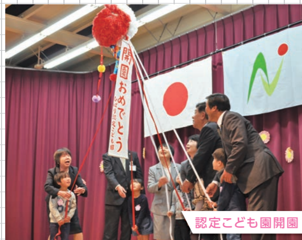
認定こども園開園

乳幼児から高齢者まで誰もが心身ともに健康で、 故郷の地で支えあいながら充実した生活ができるよう、 健康、医療、福祉、少子高齢化対策などの充実を図ります。