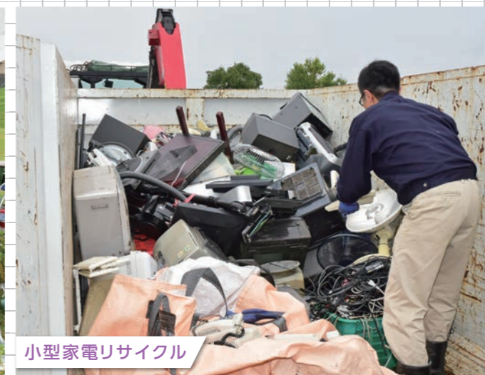
小型家電リサイクル