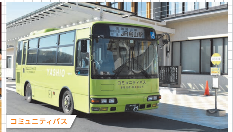
コミュニティバス