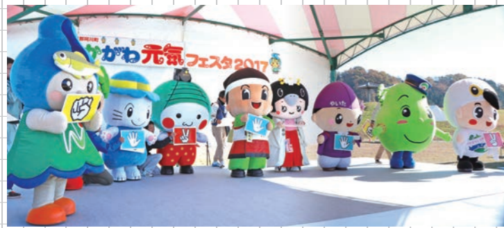
なかがわ元気フェスタ2017