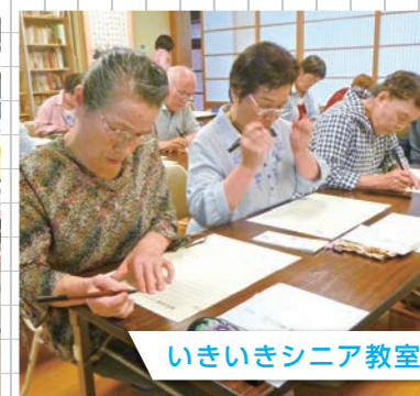
いきいきシニア教室