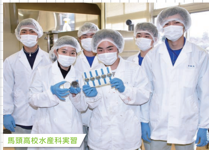
馬頭高校水産科実習

これまで引き継がれてきた豊かな地域資源を守りながら、今ある産業をより安定したものにするとともに、新たな連携や結びつきにより産業の裾野を広げ、地域資源の価値を高め、働く場の確保・創出を図ります。また、交流人口を増やしにぎわいの創出を図ります。