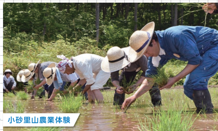
小砂里山農業体験