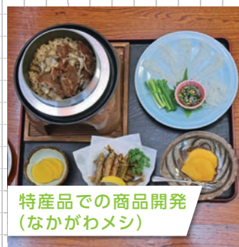
特産品での商品開発 (なかがわメシ)