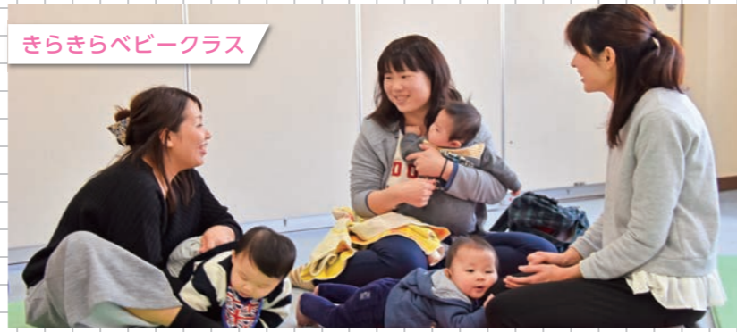
きらきらベビークラス