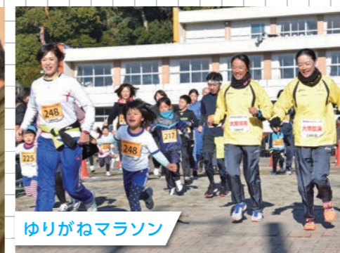
ゆりがねマラソン