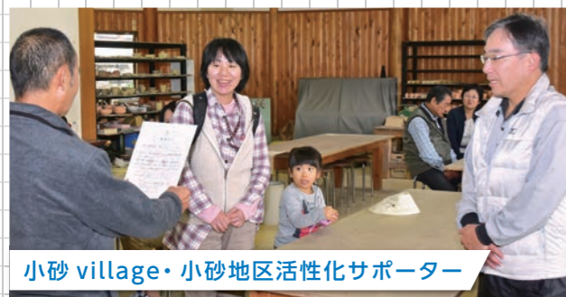
小砂 village・小砂地区活性化サポーター