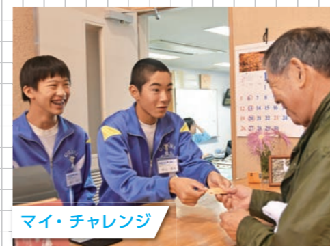
マイ・チャレンジ