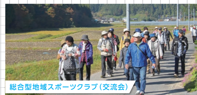
総合型地域スポーツクラブ(交流会)