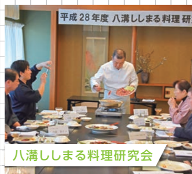
平成28年度 八満しまる料理研