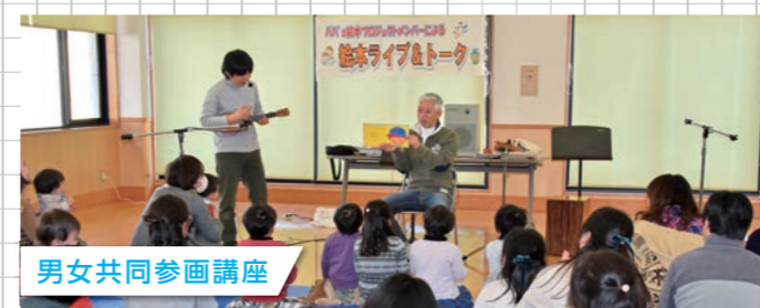
男女共同参画講座