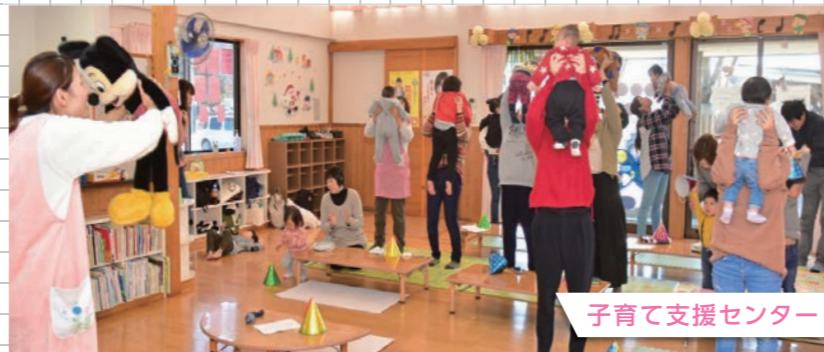
子育て支援センター