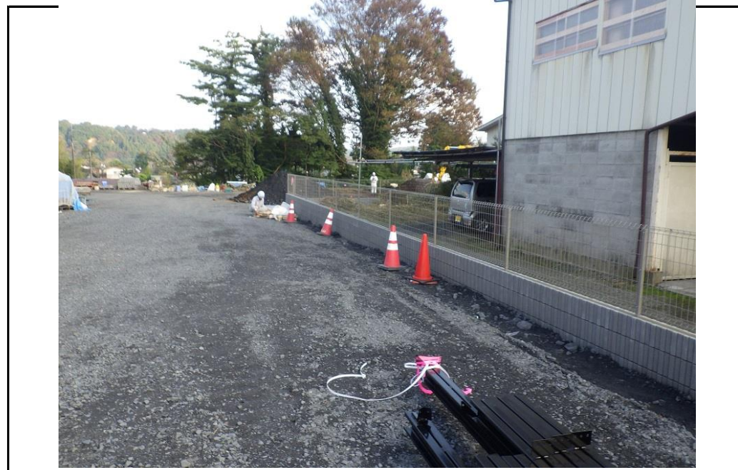
敷地南側の外構工事が始まり、擁壁とフェンスを造っています