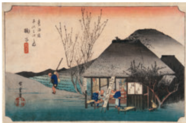
「東海道五拾三次之内 韃子 名物茶屋」 歌川広重 当館蔵

画面に大きく描かれた藁葺き屋根の小屋は、 わらぶき 韃子宿の茶店です。看板には、「名ぶつとろ汁」「おちゃづけ」「酒さかな」などと書かれています。