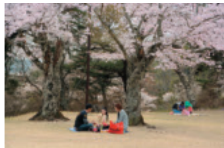
観光協会長賞「お花見」