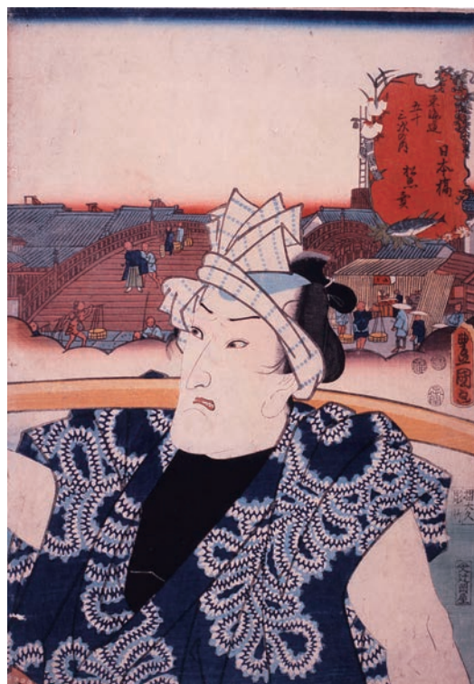
「東海道五十三次の内 日本橋 松魚売」 三代目歌川豊国