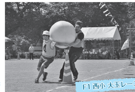
F1 西小 大玉レース