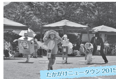
たかがけニュータウン 2015