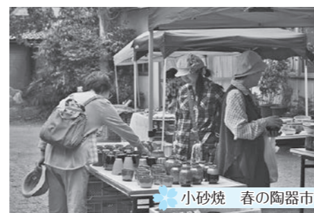
小砂焼 春の陶器市