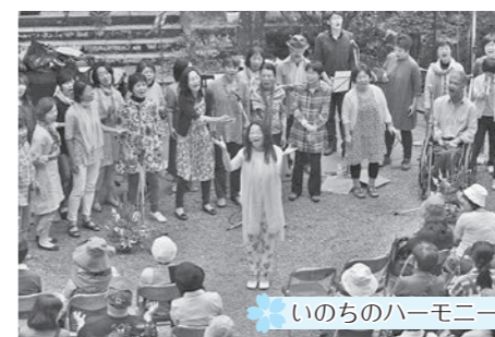
いのちのハーモニー