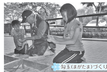
勾玉(まがたま)づくり

4月29日から5月5日まで、町内全域で「花の風まつり」が開催されました。天気にも恵まれ、各イベント会場は町内外から多くのお客様を迎え、賑わいをみせていました。5月3日・4日には小砂焼春の陶器市も同時開催されました。