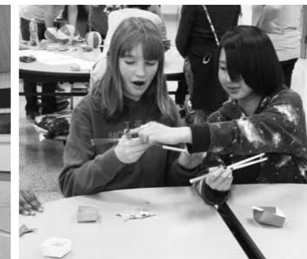
文化交流体験 お箸の使い方