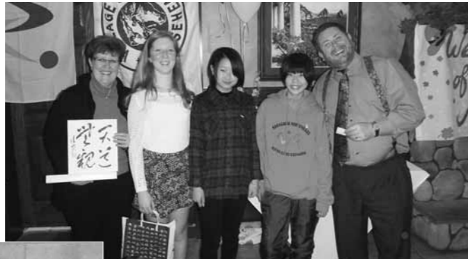
ウェルカムパーティでホストファミリーと