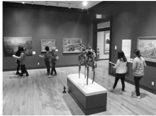
ロックウエル西部美術館