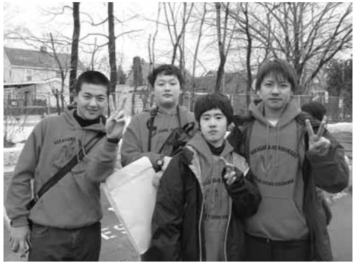
おそろいのトレーナーで