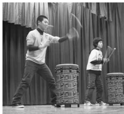
ありがとうパーティ 太鼓披露