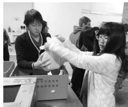
フードバンクボランティア