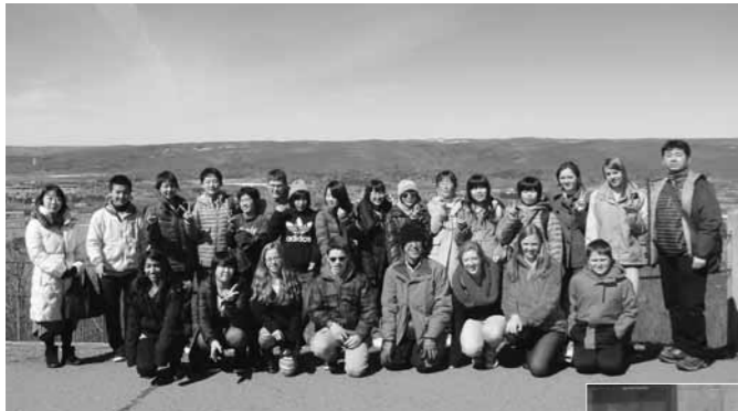
ホースヘッズの高台で