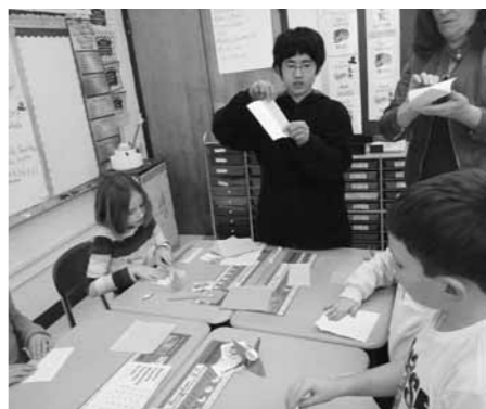
小学生と折り紙交流