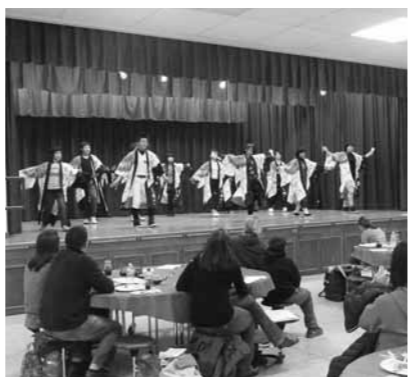
ありがとうパーティで