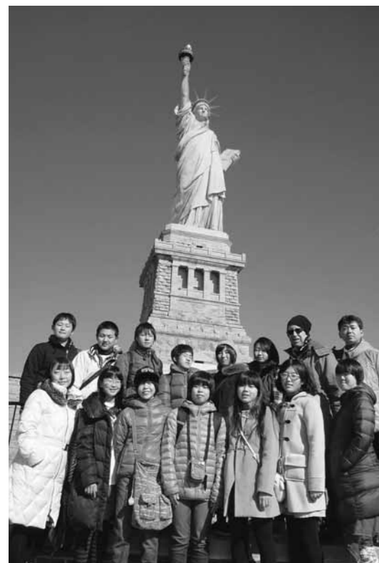
自由の女神の前で