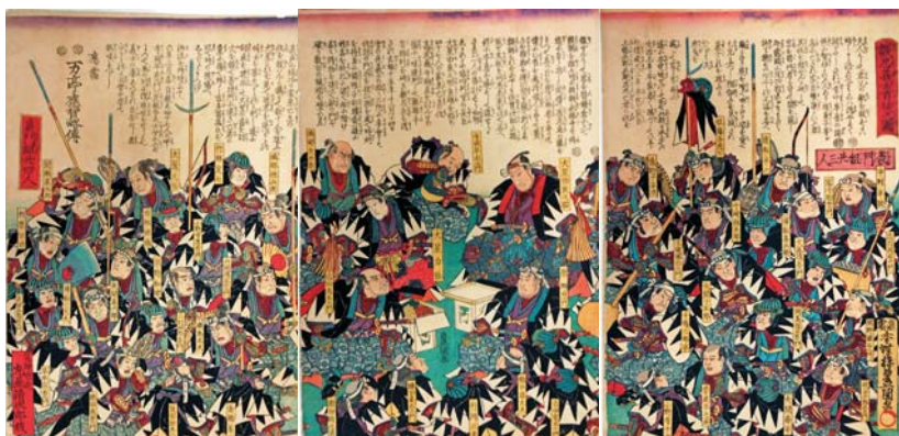
「誠忠義士首途之図」大判三枚続 三代目歌川豊国