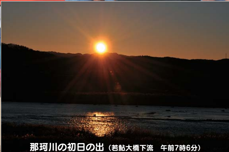
那珂川の初日の出 (若鮎大橋下流 午前7時6分)