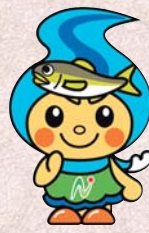
町のイメージキャラクター 「なかちゃん」