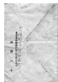
西條八十からの手紙 個人蔵