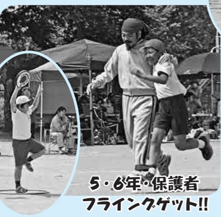
5・6年・保護者 フラインクゲット!!