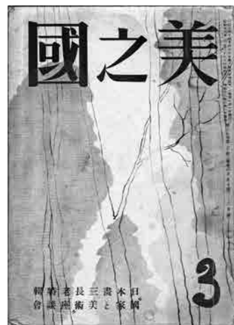
美術雑誌「美の国」 個人蔵