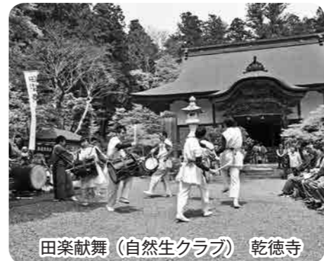
田楽献舞（自然生クラブ） 乾徳寺