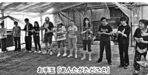
お手玉「あんたがたどこさ」