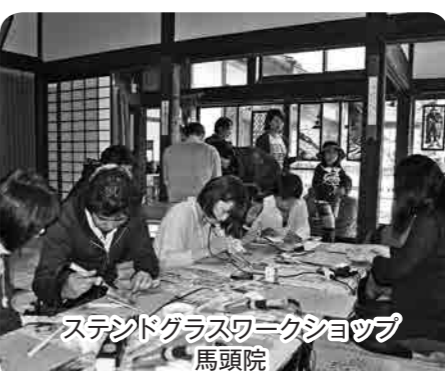
ステンドグラスワークショップ 馬頭院