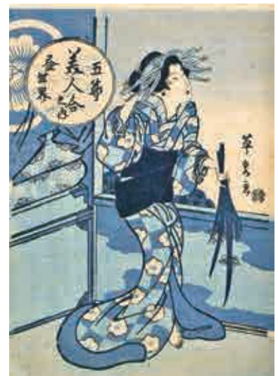
「五節美人合之内 昼世界」 千葉市美術館蔵

図は、その英泉の藍摺絵の一枚で、「五節美人合之内 昼世界」という作品です。端午の節句の妓楼の様子で、菖蒲を持つ遊女が描かれています。昼なので客もまばらで暇なのでしょう。のんびりとした空気が伝わってきます。五月といえば当時は夏の暑い時期ですが、藍で摺ることによって涼しげな作品に仕上がっています。