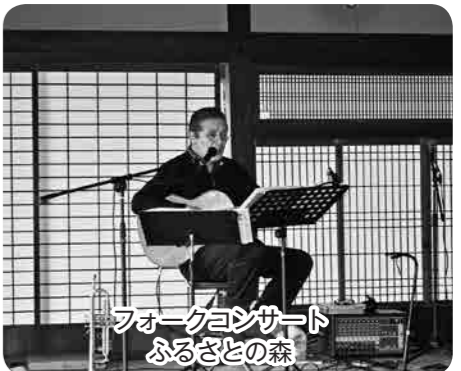
フォークコンサート ふるさとの森