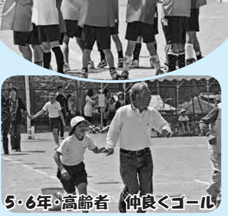
5・6年・高齢者 仲良くゴール