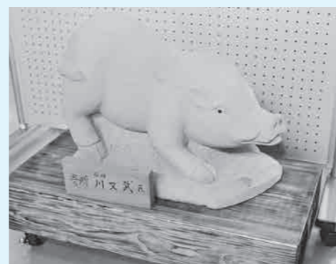
観光センター(道の駅)に展示中