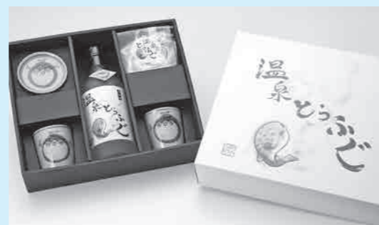
平成23年度商品化デザイン「温泉とらふぐヒレ酒セット」