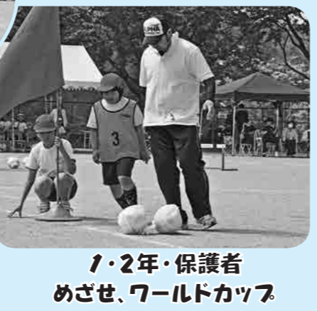
1・2年・保護者 めさせ、ワールドカップ

5月18日、馬頭西小学校で運動会が開催されました。初夏の青空の下、子どもたちはおもいきり校庭を駆け回り、爽やかな汗を流していました。