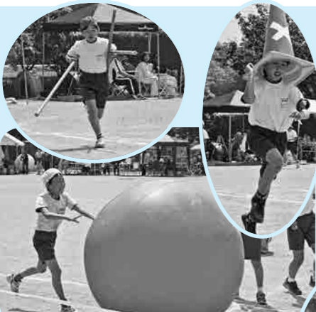
3・4年 海賊王に俺はなる!!