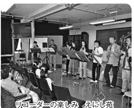
リコーダーの楽しみ えにし苑