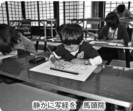
静かに写経を 馬頭院