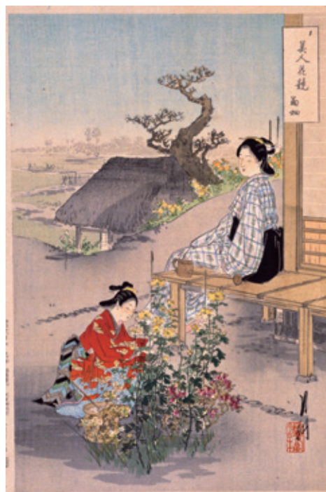
尾形月耕「美人花競 菊畑」