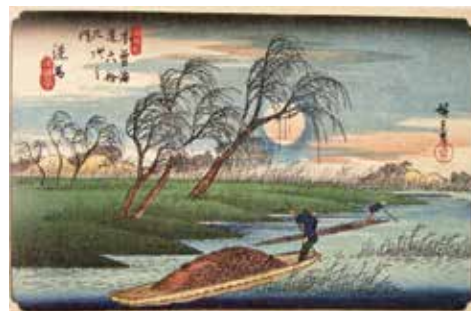
「木曾街道六拾九次之内 洗馬」