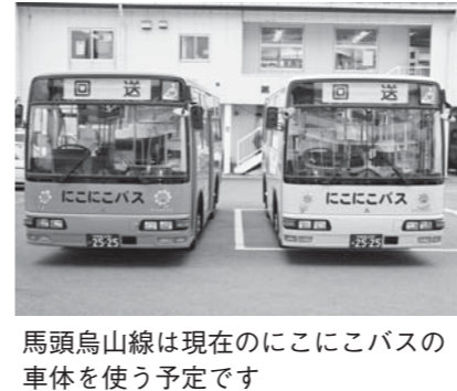
馬頭烏山線は現在のここにこバスの車体を使う予定です