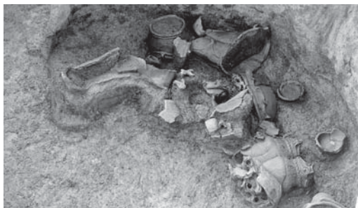
袋状土坑から出土した土器のようす 小鍋前遺跡