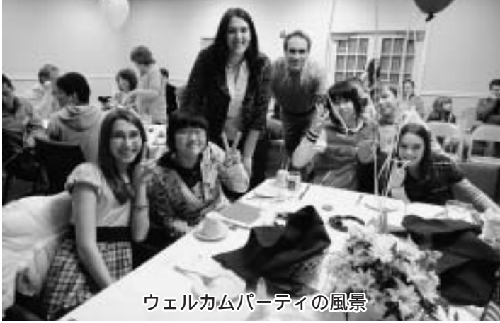
ウェルカムパーティの風景