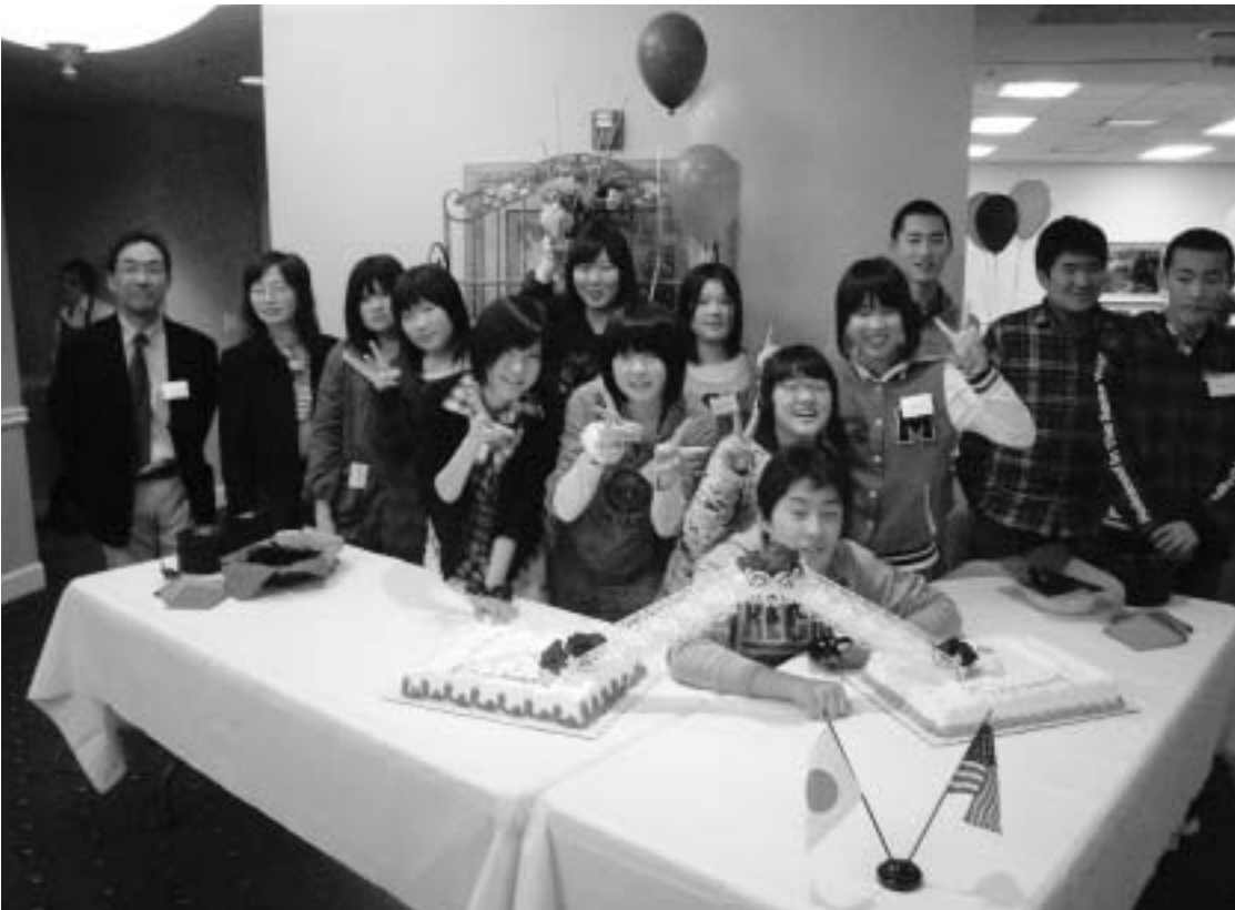
ウェルカムパーティの風景 手前の2つのケーキは那珂川町とホースヘッズ村を表し、橋で結ばれています。

平成21年度町青少年海外 体験学習は、3月12日から 23日までの12日間、米国ホー スヘッズ村などを訪問しま した。