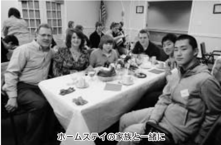
ホームステイの家族と一緒に