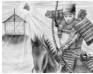
屋久島の合戦で扇を射る那須余一

最近、戦国時代の武将や、それに関わる城跡が人気となり、歴史ブームが起こっています。今回は、那珂川町に深い縁のある人物と、その城跡を紹介したいと思います。那須地域は豪族・那須氏と深い関係にあります。そのなかで、日本中で名前の知られている人物といえば、平安時代末に登場する那須与一が上げられます。