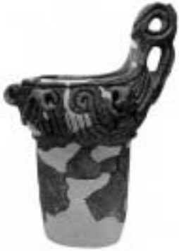
松の木遺跡の土器 (茂木町教育委員会蔵)

松の木遺跡は那珂川の支流である逆川の左岸台地上にあり、那珂川の合流地点までは三キロメートルほどです。今から約四五〇〇年、三五〇〇年前にかけての縄文時代中期後半から後期前半を中心に栄えた大規模な集落跡で、竪穴住居や貯蔵用の袋状土坑が多数