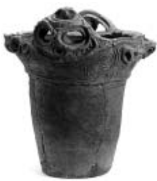
浄法寺遺跡の人面把手付土器