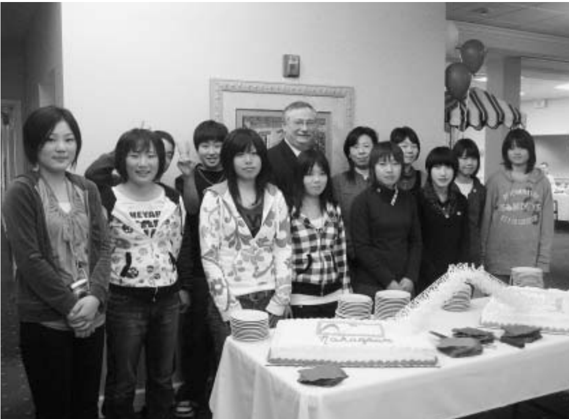
ウェルカムパーティーの風景。手前の2つのケーキは橋で結ばれ、両町村の友好を表しています。

平成20年度町青少年海外体験学習は、3月12日から23日までの12日間、米国ホースヘッズ村などを訪問しました。生徒12人（馬頭中6人、小川中4人、烏山女子高2人）の訪問団は、ホースヘッズ村滞在での7日間をホームステイ家族と過ごし、アメリカの家庭や学校生活を肌で感じてきました。驚きと感動の日々を写真や生徒の感想をとおしてご紹介します。