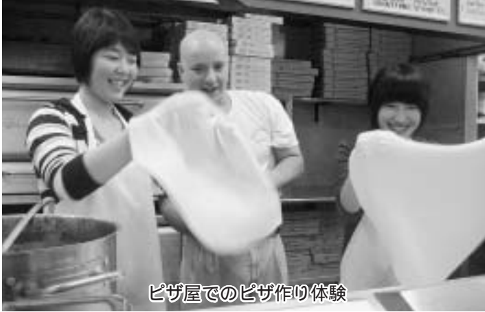
ピザ屋でのピザ作り体験