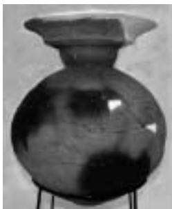
三輪仲町遺跡1号墳出土土師器壺