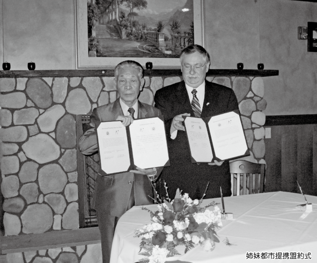
姉妹都市提携盟約式