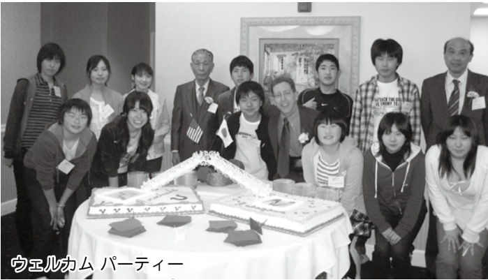
ウエルカムパーティー