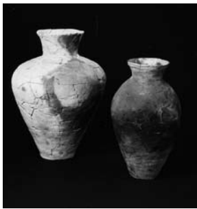
弥生土器 (滝田内遺跡)