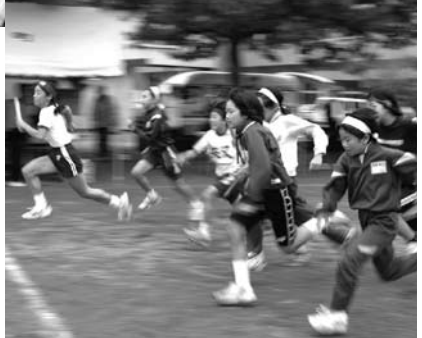
第35回町民体育祭(馬頭)より

○自治組織支援のための補助金 運営補助については均等割、世帯数割により、1行政区あたり平均4万円程度の支援をします。 また、まちづくり補助金として、モデルとなる行政区、地域団体等に実績に応じて補助する方針です。 ○行政区長、班長の報酬 行政区長、班長の業務に応じて報酬を支払います。