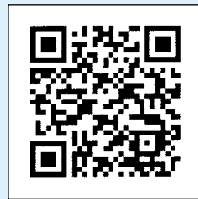
那珂川警察署QRコード

に、空のメール（題名、本文は一切つけないものです）を送っていただくだけで自動的に登録され、情報を受け取ることができます。