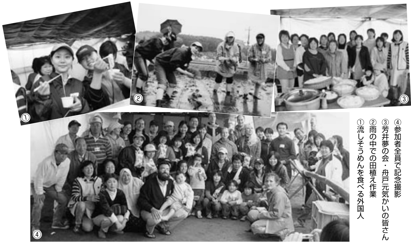
① 参加者全員で記念撮影 ② 芳井夢の会・舟戸元氣かいの皆さん ③ 雨の中での田植え作業 ④ 流しそうめんを食べる外国人

田植え終了後は、「芳井夢の会」や「舟戸元氣かい」の方々の手作りの料理や流しそうめんに舌鼓を打ちました。