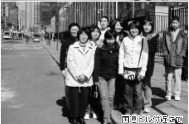
国連ビル付近にて