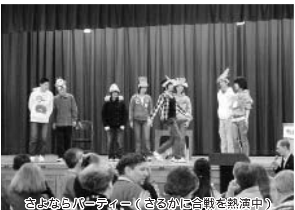
さよならパーティー（さるかに合戦を熱演中）