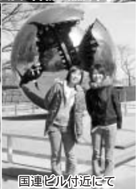
国連ビル付近にて