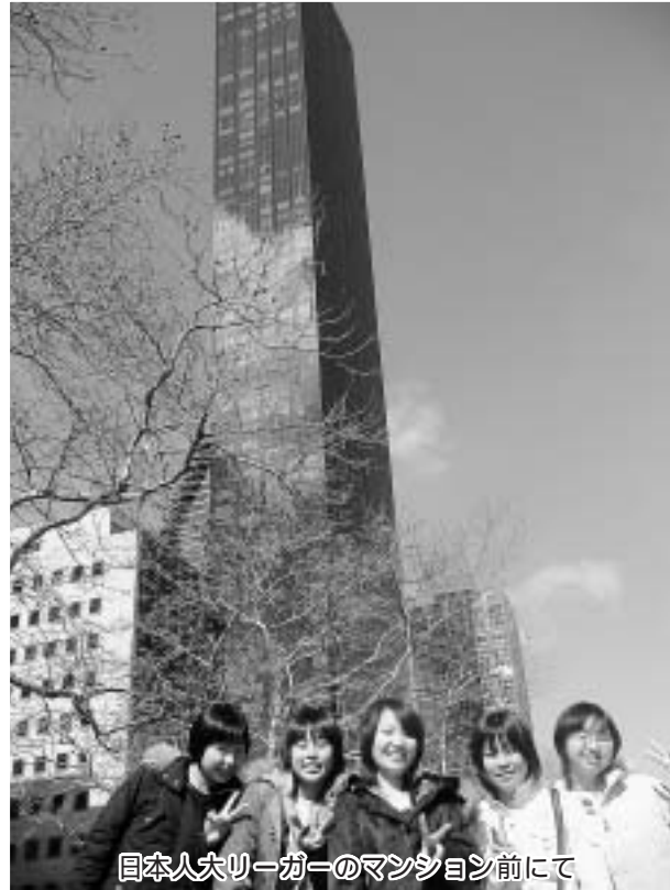
日本人大使館のマンション前にて