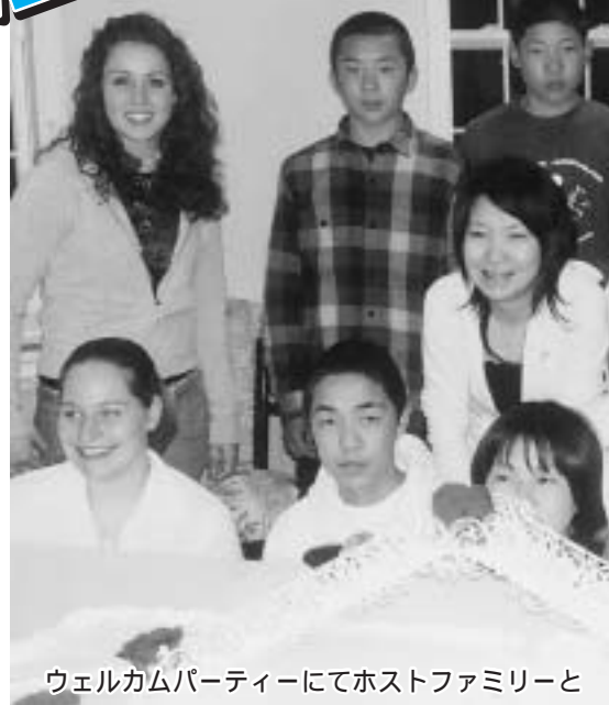
ウェルカムパーティーにてホストファミリーと