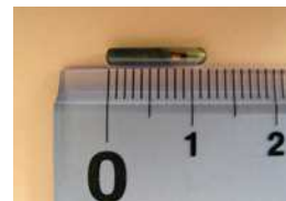
マイクロチップの写真 (実物大)

○安全性の高い動物の個体識別方法として、ヨーロッパやアメリカなど世界中で広く使用されています。