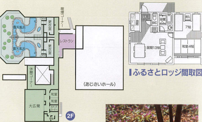
ふるさとロッジ間取図