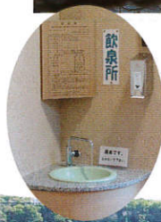
身体の中から健康になれる飲泉所