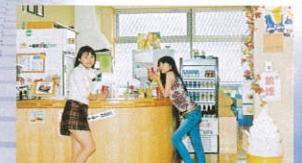
スナックコーナー