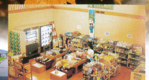
おみやげや入浴に必要な物を販売