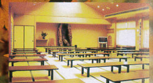
床柱に樹齢800年の日本を利用した128名収容の大広間、有料の8畳間2室をご用意。