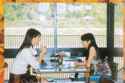
50名収容可能なレストランは、地元の食材を取り入れた多くのメニューを取り揃えております。