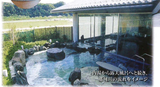
内湯から露天風呂へと続き、 那珂川の流れをイメージ

四季感あふれる彩りの 自然の中に湧く天然温泉。 それは那珂川のほとりにある「湯親館」。