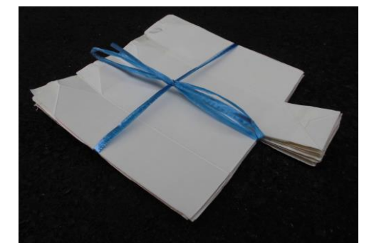
紙パック ※内側がビニールや銀色の ものは燃やすゴミへ