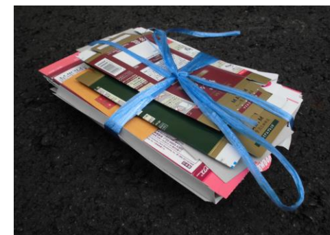
包装紙(紙箱) (お菓子の箱等)