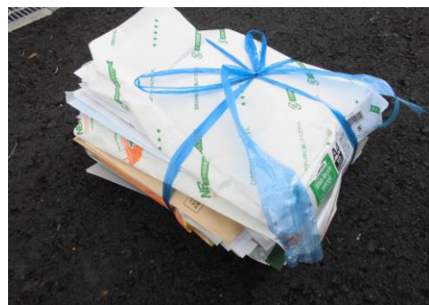
雑紙 (コピー用紙等)