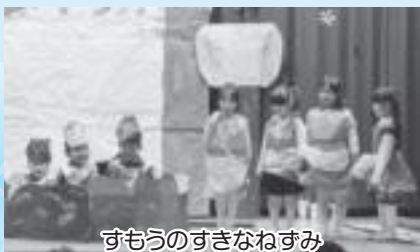
すもうのすきなねずみ