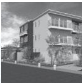
エミナル那珂川(完成イメージ図)

結びに、今年一年の皆様の ご多幸とご健勝をお祈り申し 上げまして、新年のごあいさ ついたします。