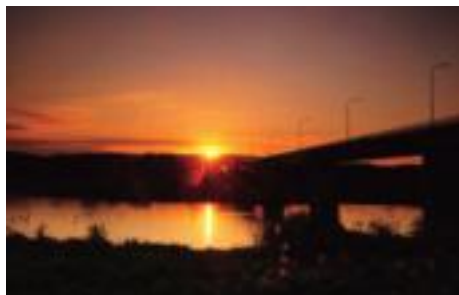
夕焼け賞「夕日に染まる那珂川」