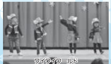
ワイワイワールド