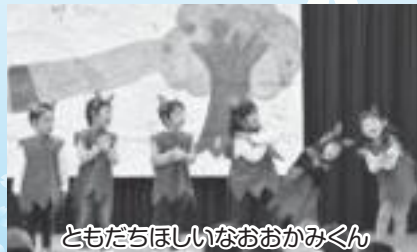
ともだちほしいなおおかみくん