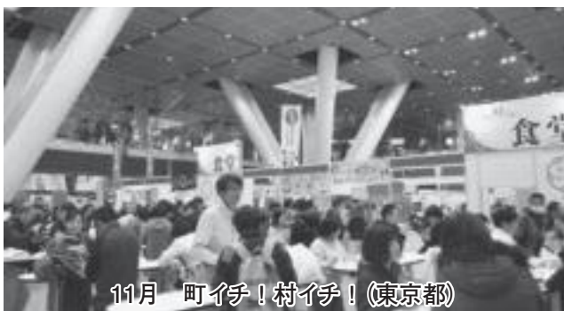
11月 町イチ!村イチ!(東京都)