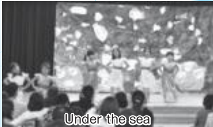
Under the sea