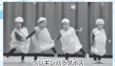
ペンギンパラダイス