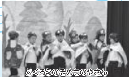
ふくろうのそめものやさん