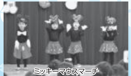
ミッキーマウスマーチ