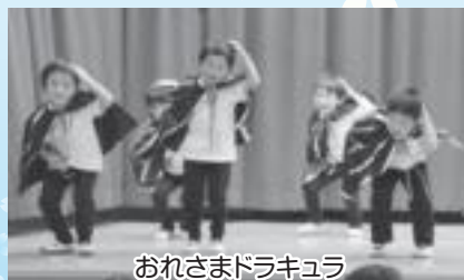
おれさまドラキュラ