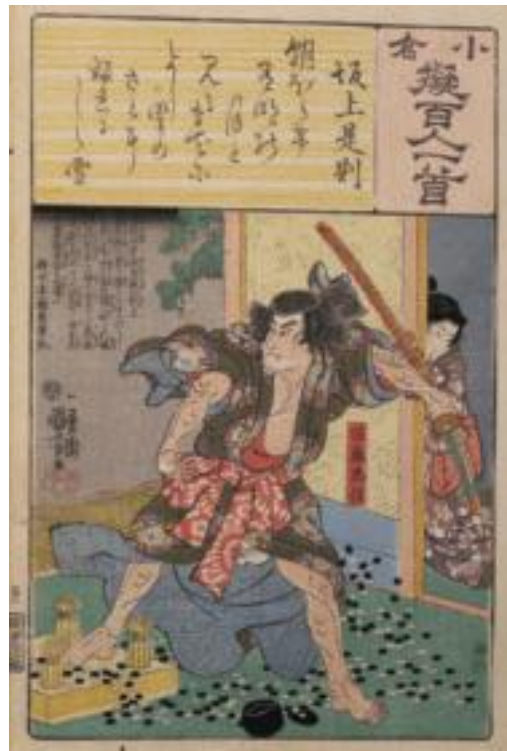
歌川国芳 「小倉擬百人一首 坂上是則」

この作品では、歌の「吉野の里」から吉野山で義経のためにひとり戦った佐藤忠信を描き、「降れる白雪」を忠信が散らした碁石に見立てています。