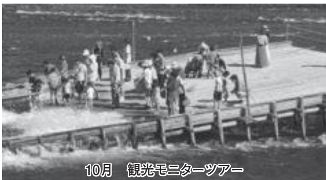
10月 観光モニターツアー

那珂川町を知れば知るほどこの地が「人と地域資源」に恵まれており、他の地域よりも確実に優位、と感じています。このことを更に多くの方々に知って頂くための活動を、これからも着実に展開していきます。皆様の応援をどうぞ宜しくお願いいたします。