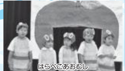
はらぺこあおむし