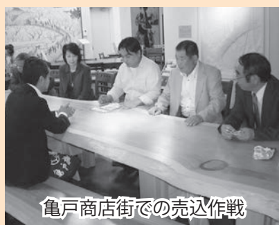
亀戸商店街での売込作戦

議会広報特別委員会では、全国町村議会広報研修会に出席した帰りに、亀戸商店街（東京都江東区）を訪問し、町のブランド品を、店に置いてもらえるようお願いしてきました。