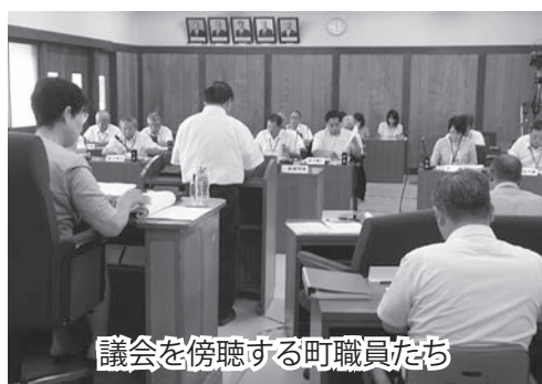
議会を傍聴する町職員たち

を結びつけて考えられるようになり、あらためて自分の仕事や立場を認識する良い機会になりました」と感想を話してくれました。