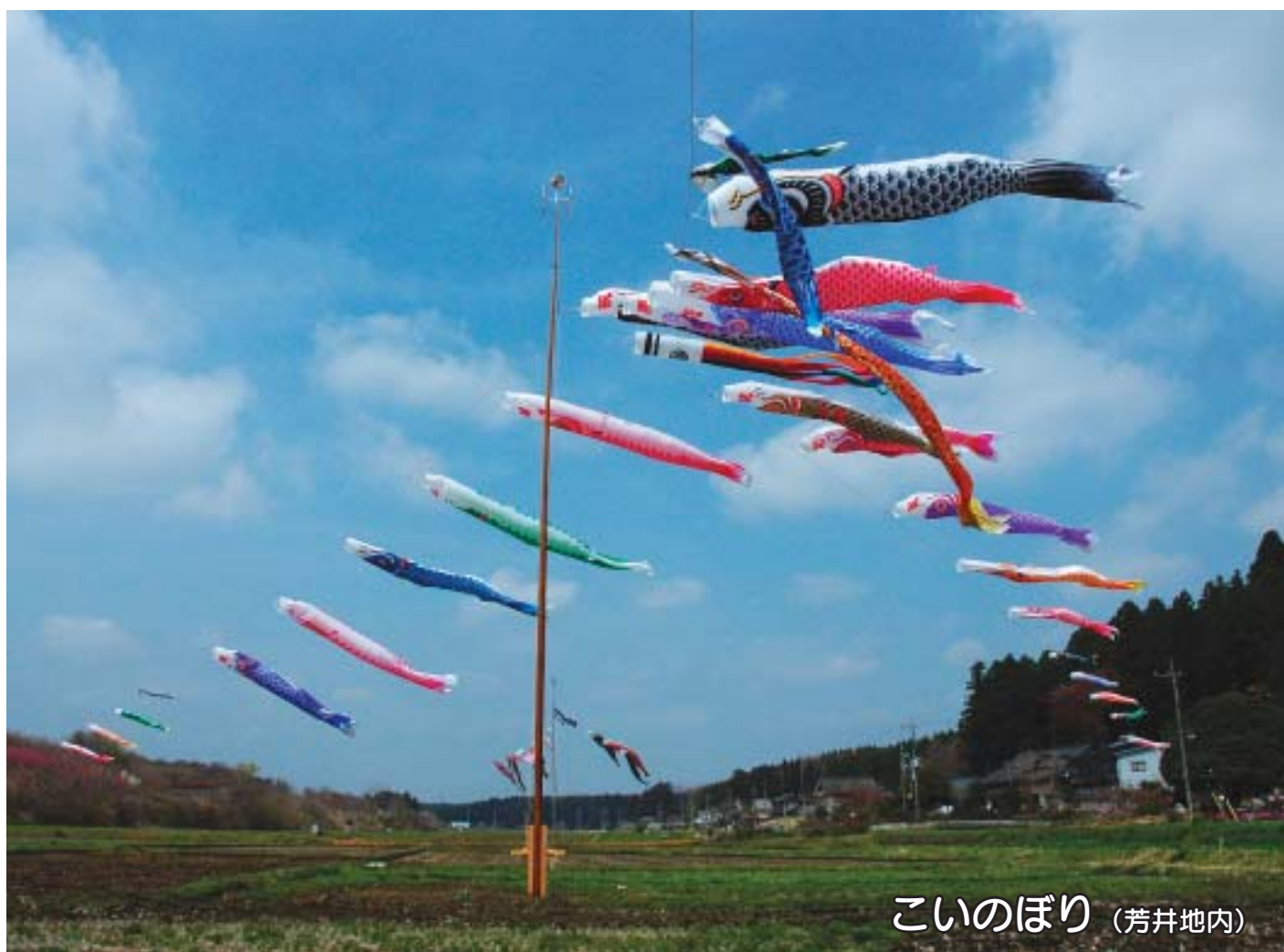
こいのぼり (芳井地内)

●発行／栃木県那珂川町議会 ●編集／那珂川町議会広報特別委員会 電話0287(96)2112 e-mail gikaigiji@town.tochigi-nakagawa.lg.jp