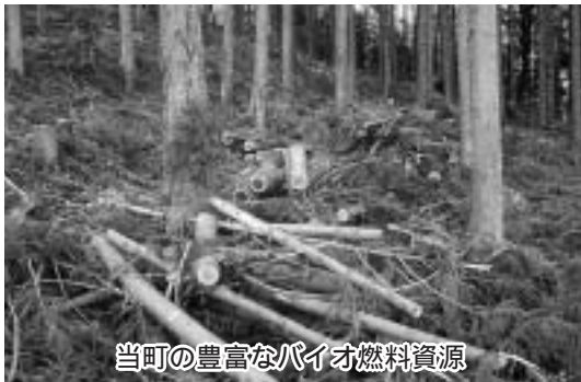
当町の豊富なバイオ燃料資源

質問 地球温暖化防止、循環型社会形成、農山漁村活性化の観点から、国を挙げて国産バイオ燃料の本格的導入、また林地残材などの未利用バイオマスの活用等によるバイオマスタウン構築の加速化施策の推進をしている。昨年の末で全国60市町村において実現に向けて動き出しており、当町でも林地残材対策、遊休農地対策、家畜排せつ物対策等にバイオマス燃料または発電などに積極的に参加すべきと思うが考えを伺う。