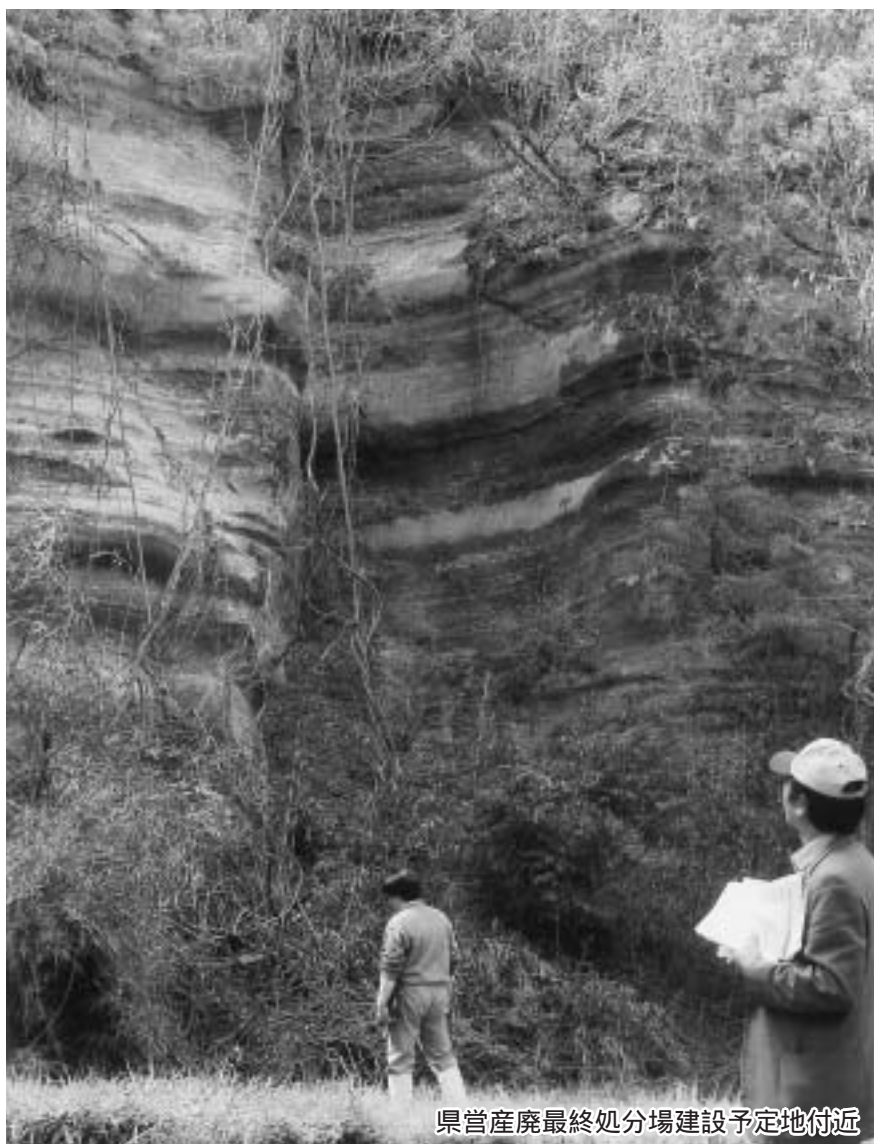
県営産廃最終処分場建設予定地付近

答弁（町長） 将来の事務事業の数量を想定の上、横断的で機動性に富む組織とはどんなものであるかを描き、ここから必要な人員を見込み、これを現況の職員数と比較した上で、定員適正化計画を策定し、職員定数の管理を図ってまいりたいと考えている。